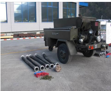
Motorspritze Typ III