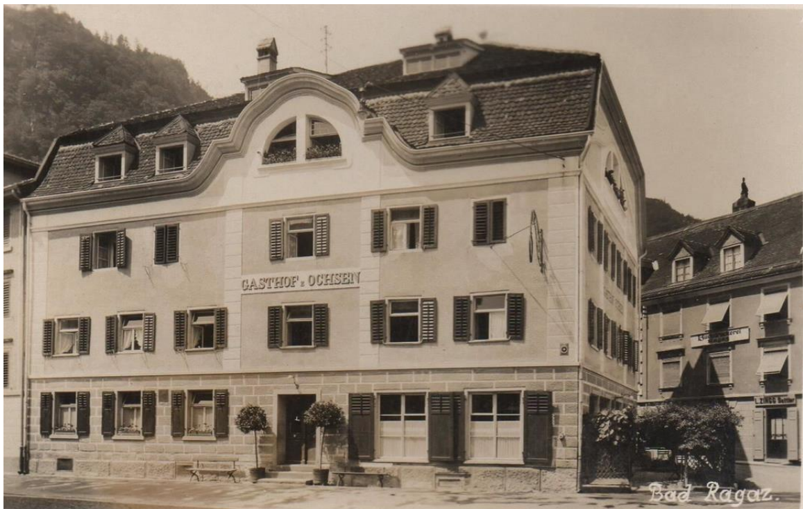
Der «alte» Ochsen. Aufnahme ca. 1930