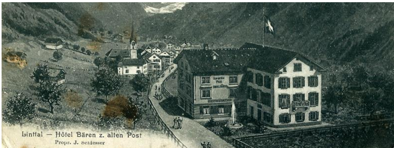
Hotel Bären Linthal, ca. 1909

Um 8.25 fuhren wir ab von hier. Während der ganzen Eisenbahnfahrt bis Mittag regnete es in Strömen. In Linthal im Hotel Bären wartet uns ein wehrhaftes Mittagessen, das einem an Leib und Seele stärkte.