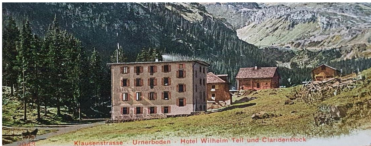
Klausenstrasse - Urnerboden - Hotel Wilhelm Tell und Claridenstock