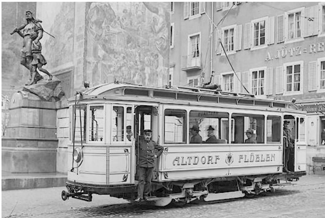
Tram Altdorf – Flüelen, in Betrieb von 1906 – 1951 (abgelöst durch Busbetrieb)

Nur kurze Zeit konnten wir uns Altdorf bisschen um dann mit dem Tram nach Flüelen zu kutschieren. Auch hier konnte man nur kurzen Aufenthalt nehmen um bald eine fröhliche Fahrt über den schönen Vierwaldstättersee zu machen bis nach Brunnen.