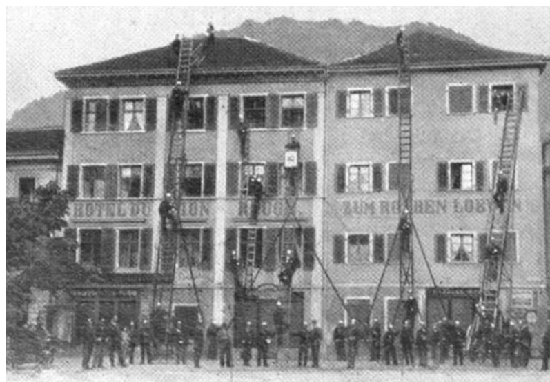
Bild: Pompiercorps Chur um 1899.