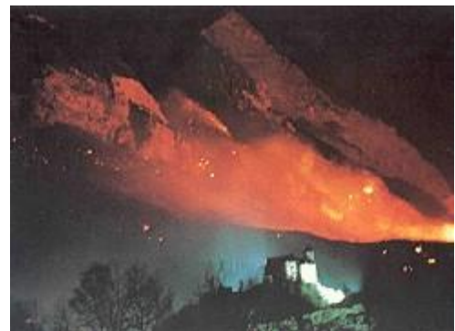
Waldbrand Balzers 05.12.1985

Habt ihr noch alte Fotos von der Feuerwehr und sucht die Geschichte dahinter? Da können wir euch eventuell helfen.