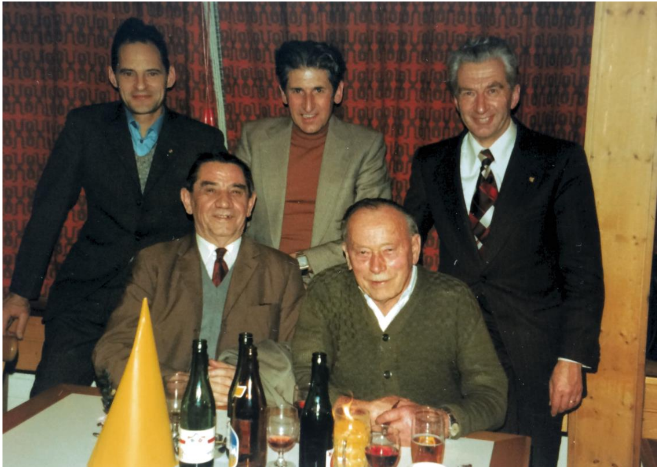
Gleich vier Kommandanten der Feuerwehr Bad Ragaz auf einem Bild. Hauptversammlung vom 24. Januar 1976 im Rössli, Quelle: Peter Bonderer