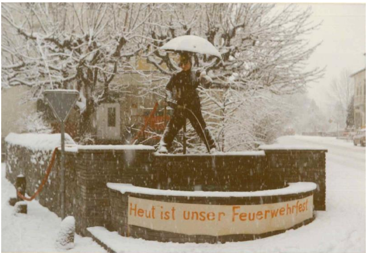
Rösslibrunnen an der HV vom 27. Januar 1973